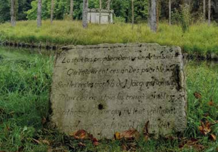
Le cénotaphe de Rousseau dans le parc Jean-Jacques Rousseau