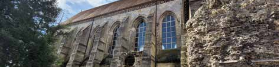
Chapelle Royale Saint-Frambourg