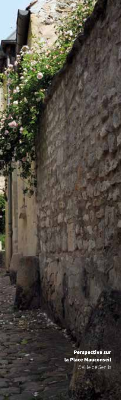
Perspective sur la Place Mauconseil

traverse la galerie d'art et le jardin, la maison s'intègre dans un îlot appelé «La croix de fer».